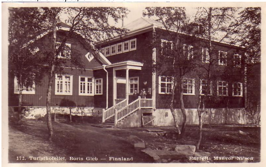
172. Turisthotellet, Boris Gleb — Finland