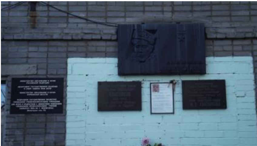
Мурманская область, Мончегорск, Кольская улица, 3/1.