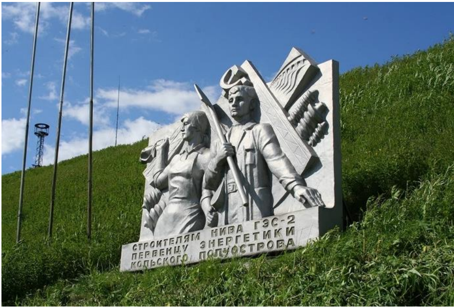
Поселок Нивский, Мурманская обл., Россия.