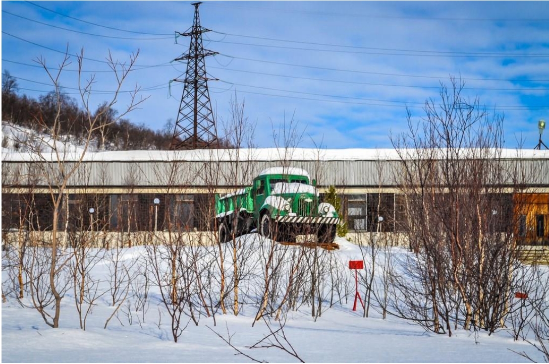
( Вероятно – расположен в п.Нивский, точных данных по расположению нет.)